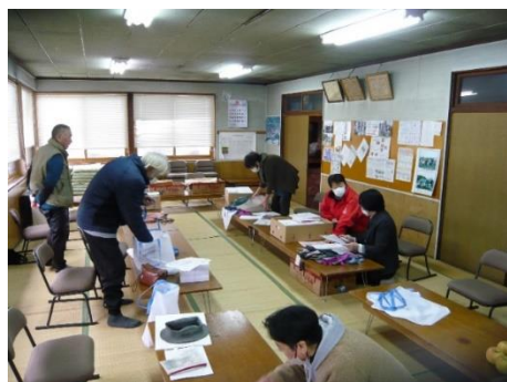
袋詰め・配布準備