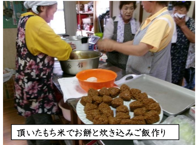
頂いたもち米でお餅と炊き込みご飯作り