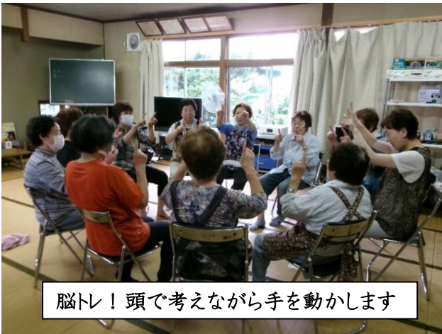
脳トレ！頭で考えながら手を動かします